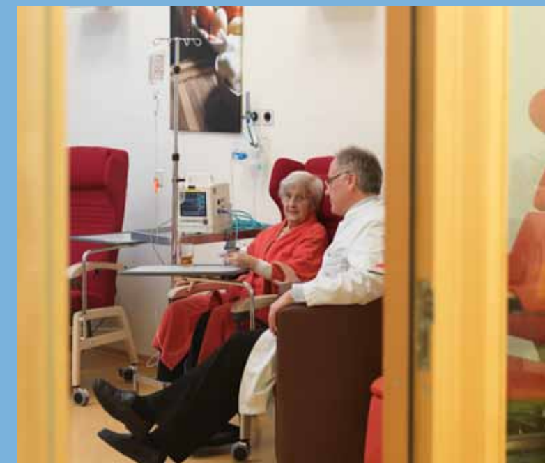
Station 5 „D.A.V.I.D.“

Diagnostik Akuttherapie Validation Innere Medizin Demenz