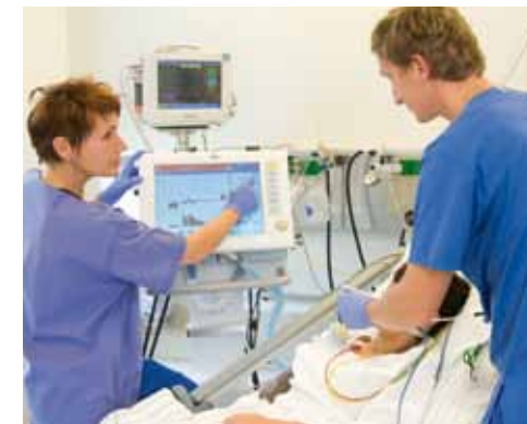
Für den Notfall: Die Intensiv-Station ist immer bereit.

Wir können auch alle Patienten aufnehmen, die eine Spezialbehandlung benötigen. Von hier aus vermitteln wir sie nach eingehender Untersuchung in das Krankenhaus oder in die Abteilung, wo die besten Spezialisten bzw. die individuell nötige Therapie vorhanden sind.