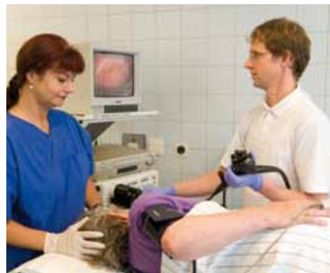
Wir wählen schonende Verfahren für Diagnostik und Behandlungen