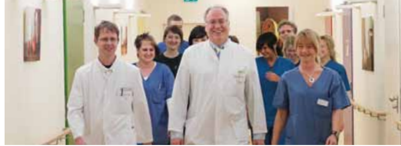
Unterschiedliche Berufsgruppen arbeiten in einem multiprofessionellen Team eng zusammen